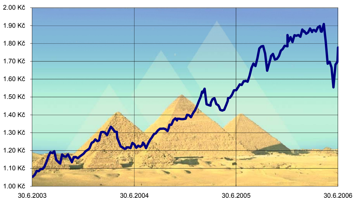
Graf vývoje kurzu podílových listů za období od 30.06.2003 do 30.06.2006

Pro lepší představu o změnách hodnoty podílového listu je uveden ještě graf, znázorňující vývoj hodnoty podílového listu v období posledních tří let.